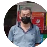
EB BSN SSC Digital Photo, Perak

“ Penduduk setempat merasa amat mudah dan senang dengan membuat bayaran bil di premis saya serta pelanggan baharu telah bertambah disamping perniagaan saya semakin maju. ”