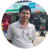
EB BSN First Mart Trading Sdn Bhd, Johor

“ Perniagaan saya berubah dan bertambah maju. Penduduk berbelanja sambil membuat transaksi seperti membayar bil. Ini menjimatkan masa pelanggan kerana tak perlu pergi ke cawangan Bank. ”