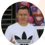
EB BSN Panda Marketing Enterprise, Perak

“ Perniagaan saya telah meningkat kerana ramai penduduk datang dan membuat transaksi di kedai saya. Antara kelebihan menjadi EB BSN, lebih dikenali masyarakat setempat. Saya bangga menjadi sebahagian daripada keluarga besar BSN. ”