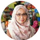
EB BSN ANZ Berkat Maju, Terengganu

“ Semenjak menjadi EB BSN seawal penubuhan EB BSN iaitu pada tahun 2012, premis perniagaan saya menjadi tempat tumpuan pelanggan yang datang untuk membuat transaksi seperti pembayaran bil selain untuk mendapatkan barang keperluan lain. ”